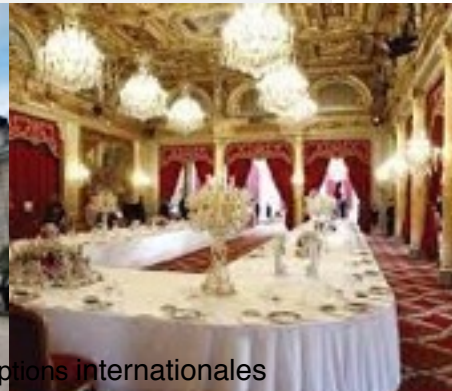
Le Palais de l'Élysée, où se tiennent le Conseil des Ministres et les réceptions internationales